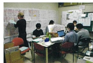
福島県沖地震(2022年) 「このゆびとまれ」の運営をサポート