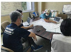
佐賀豪雨(2021年) 地元団体の運営支援、現地課題の解説と今後の方針アドバイス