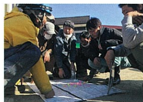
台風19号(2019年) 地域の方や組織と連携した廃棄物撤去作戦「ONE NAGANO」の立案・実働サポート