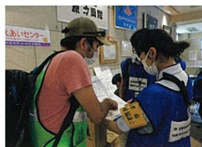
静岡豪雨(2021年) 沼津市社協の災害対応をサポート、訪問調査の戦略づくり